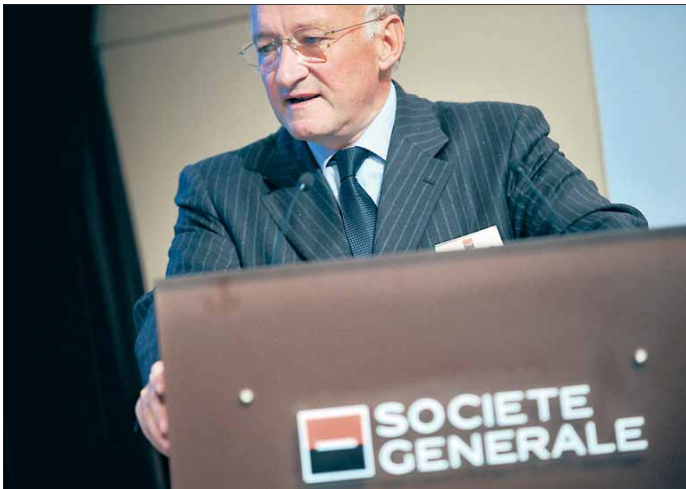
Spricht von einem Einzeltäter: Daniel Bouton, Vorstandschef der französischen Großbank Société Générale, bei der Pressekonzferenz in Paris.

Bouton nannte den Händler einen „Einzeltäter“. Er sei am Sonntag überführt worden. Von Montag bis Mittwoch